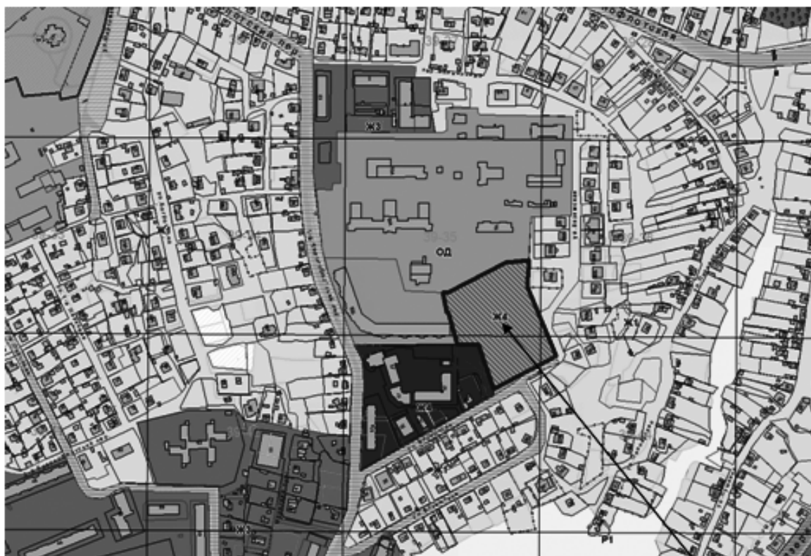
Схема расположения земельного участка, расположенного по адресу: Российская Федерация, Смоленская область, город Смоленск, 1-й Краснофлотский переулок, дом 15

Земельный участок с кадастровым номером 67:27:0020231:26, включенный в границы территориальной зоны Ж4