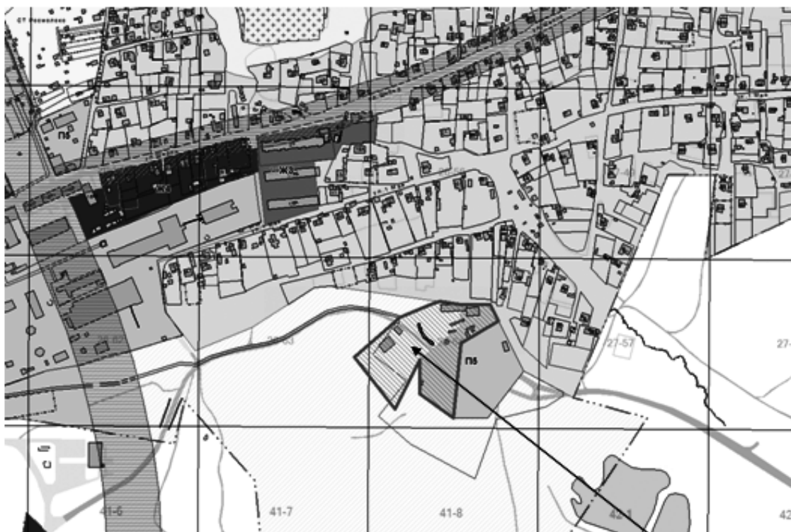
Схема расположения земельного участка, расположенного по адресу: Российская Федерация, Смоленская область, город Смоленск, карьер «Шейновка»

Земельный участок с кадастровым номером 67:27:0030513:6, включенный в границы территориальной зоны П5