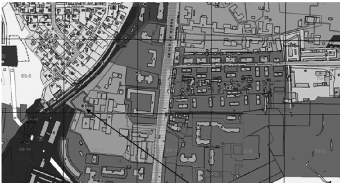
Схема расположения земельного участка, расположенного по адресу: Российская Федерация, Смоленская область, город Смоленск, Киевский переулок

Земельный участок с кадастровым номером 67:27:0020842:5, включенный в границы территориальной зоны ЖЗ