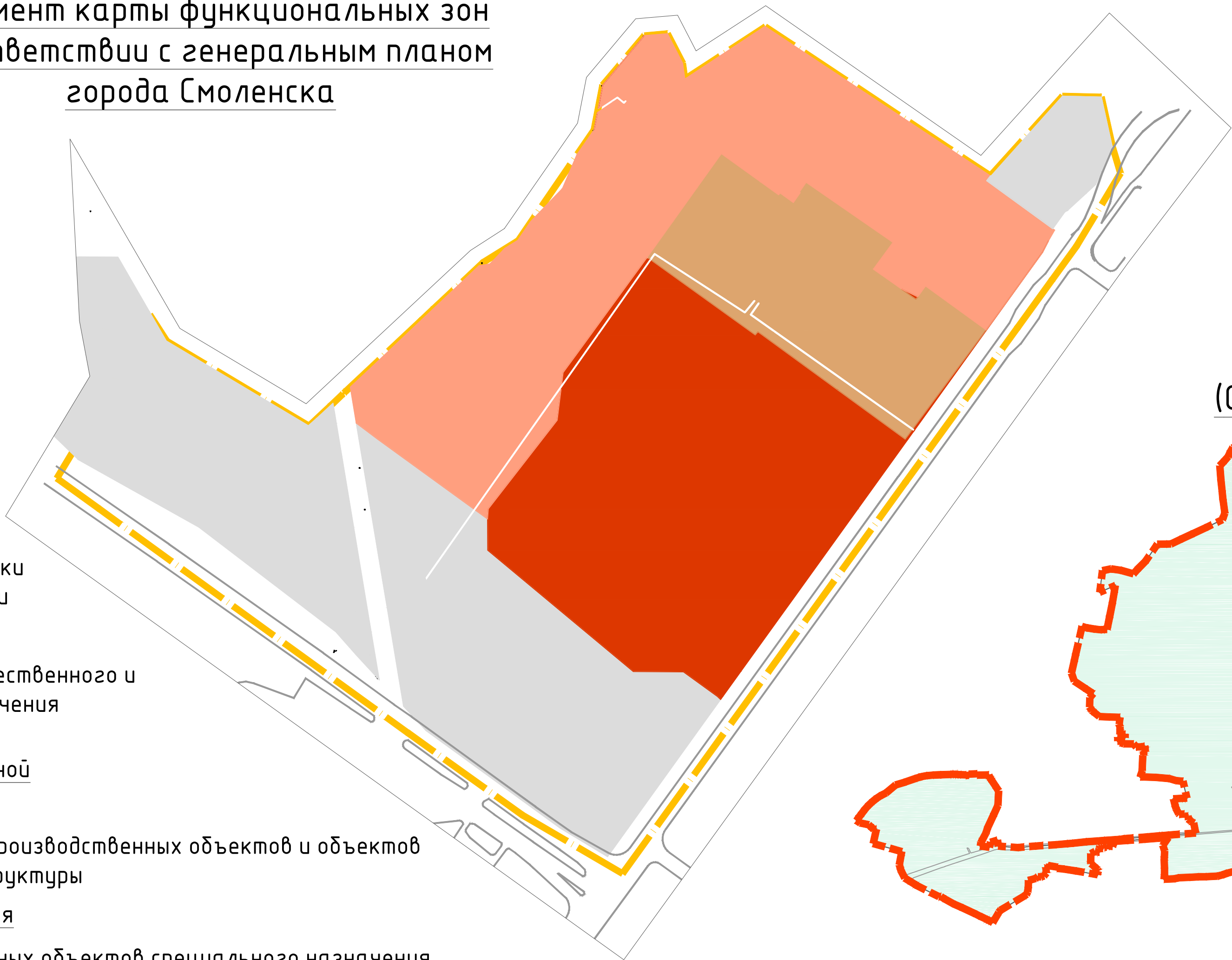
Схема расположения элемента планировочной структуры (Схема размещения проектируемой территории в структуре поселения)

– зона размещения иных объектов специального назначения