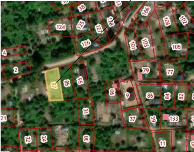
Место расположения земельного участка