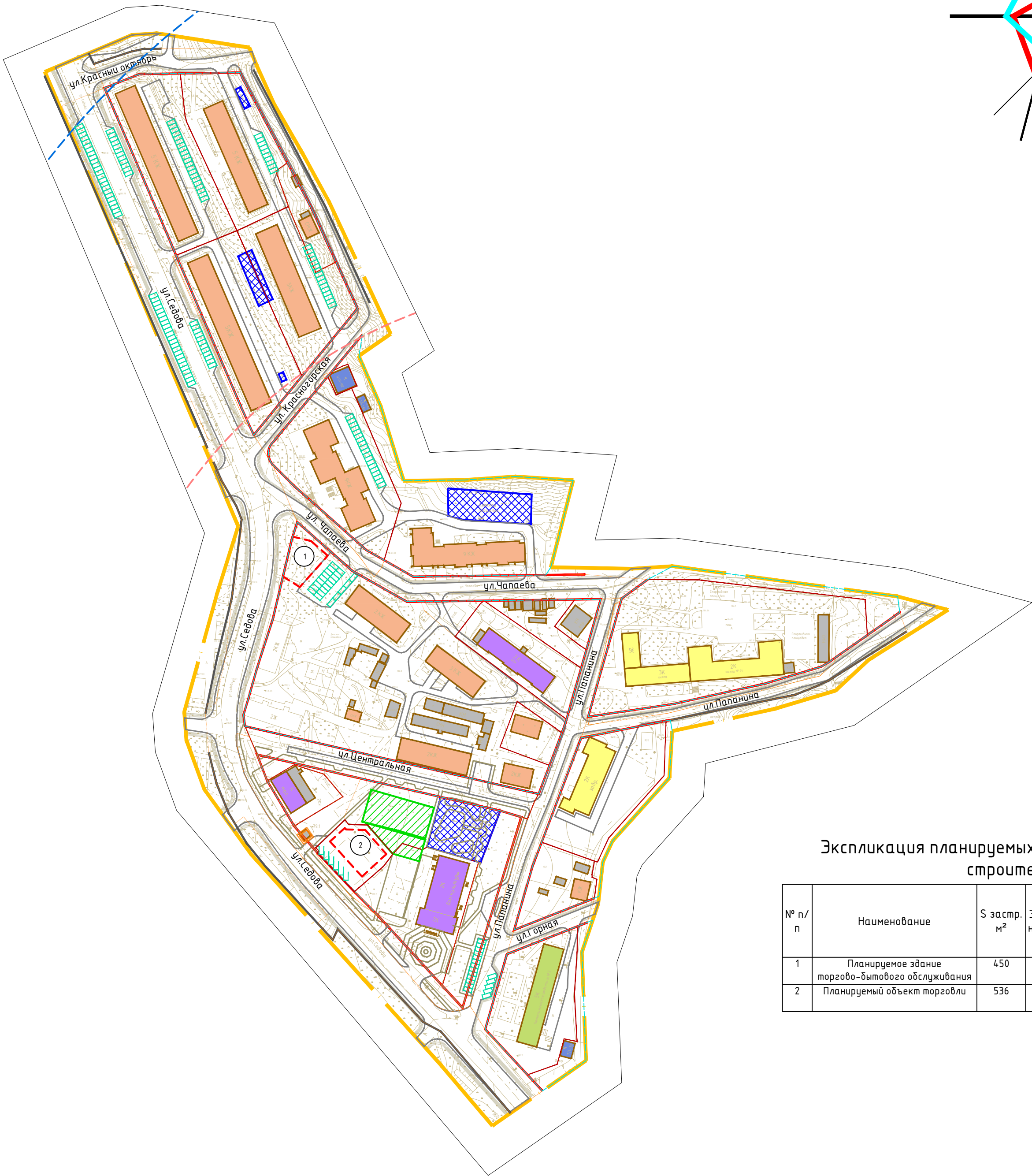
Экспликация планируемых объектов капитального строительства