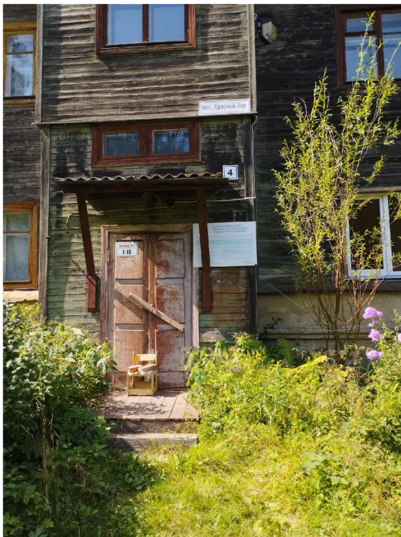
Состояние аварийного жилья на момент разработки проекта