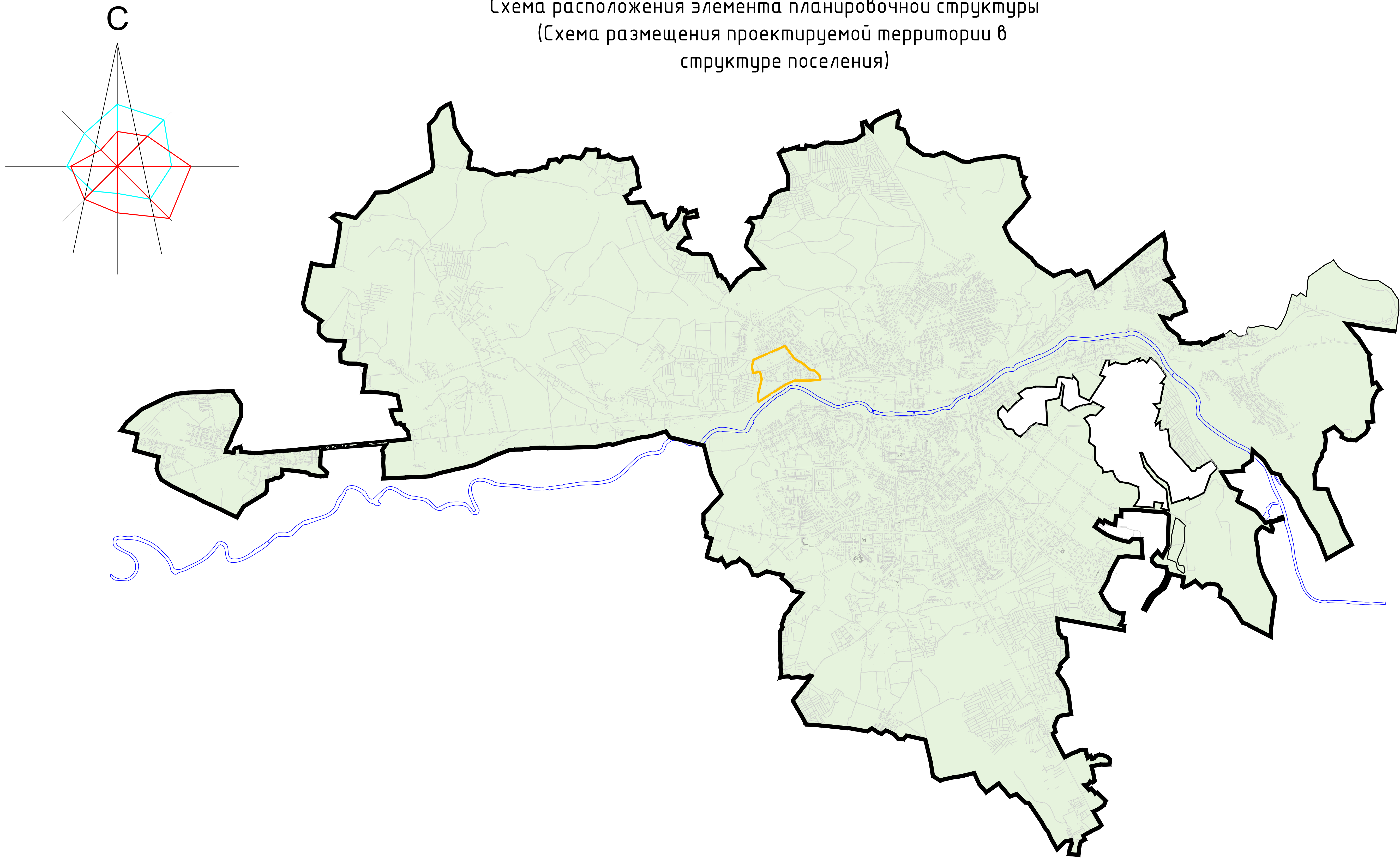
Схема расположения элемента планировочной структуры (Схема размещения проектируемой территории в структуре поселения)