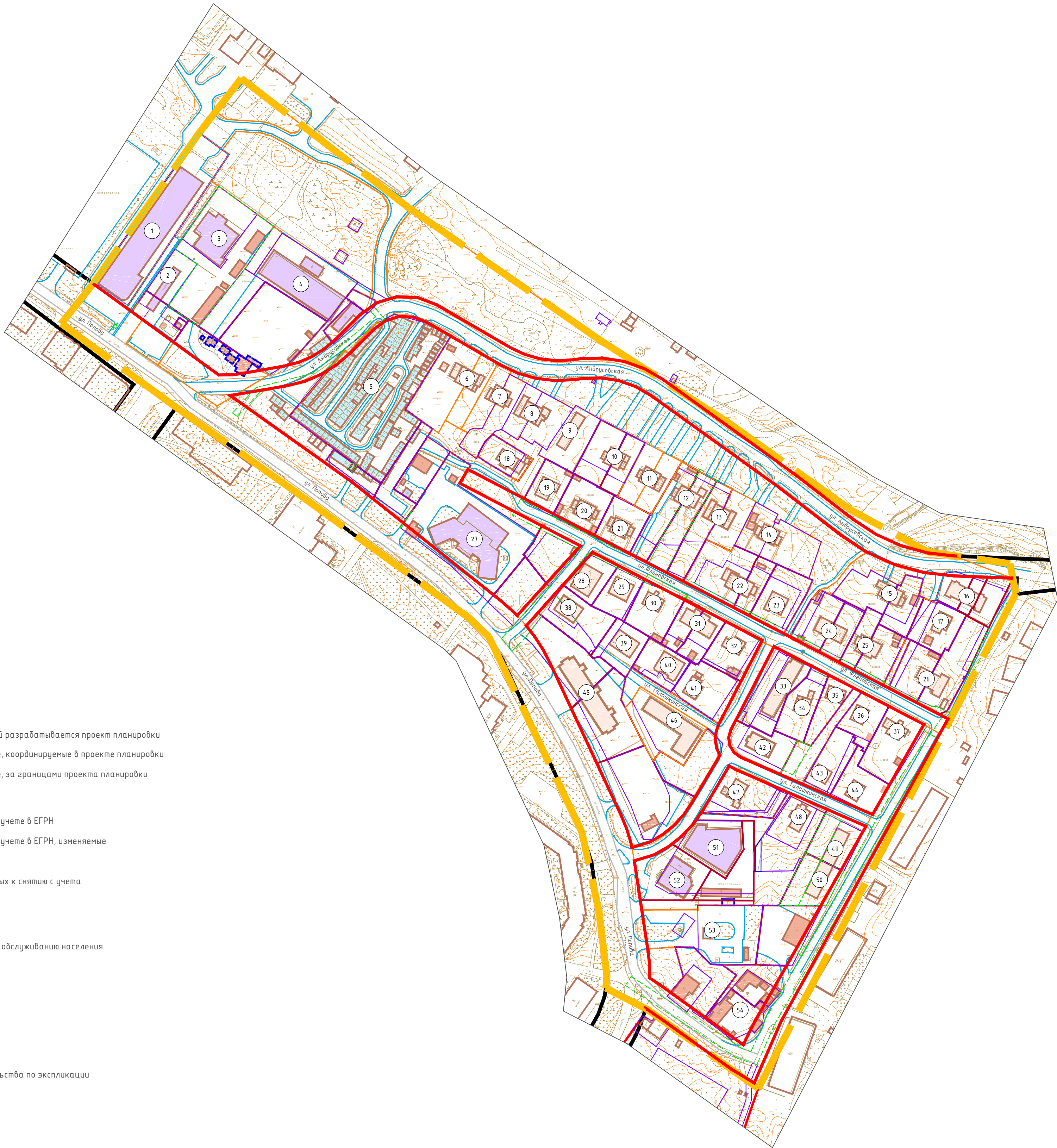
Экспликация объектов капитального строительства